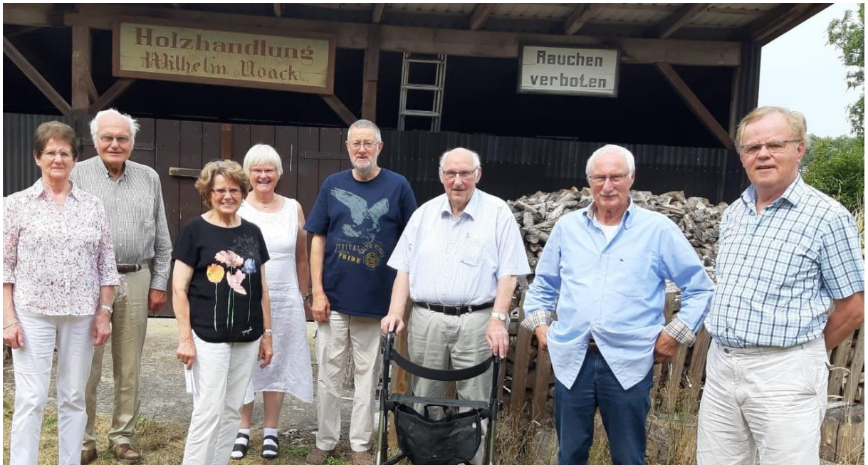
Die Noacks aus Fohlenplacken besuchen die Windheimer Noacks