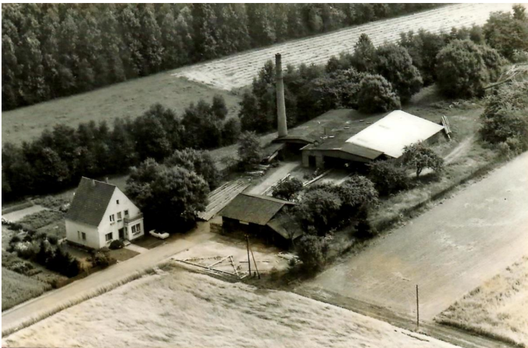
Das Firmen-Gelände an der Heerstr. mit dem markanten, 20 m hohen Schornstein für die Dampfmaschine zum Antrieb der Sägen und Gatter.