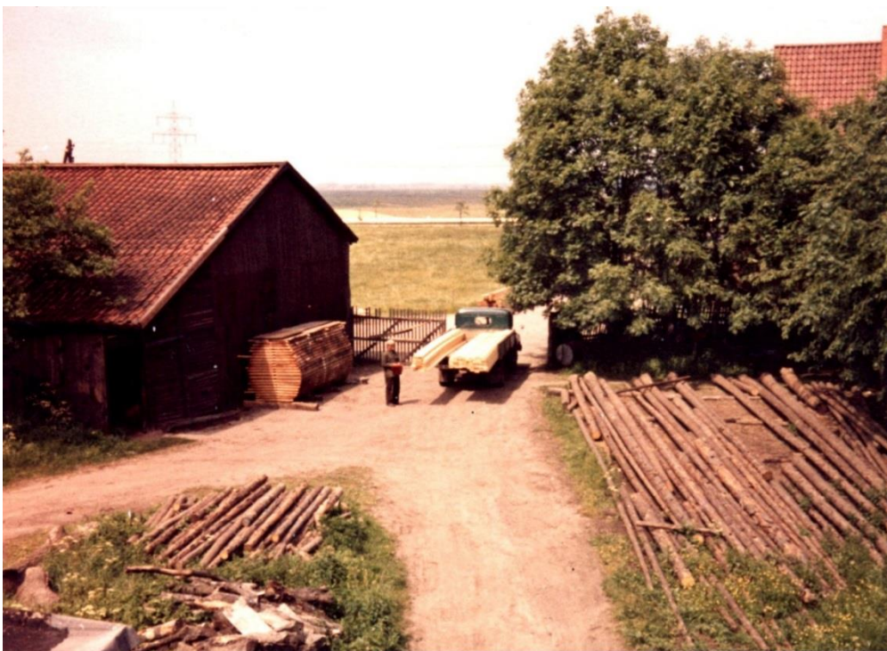
Blick vom Schornstein auf den Vorplatz des Sägewerkes.