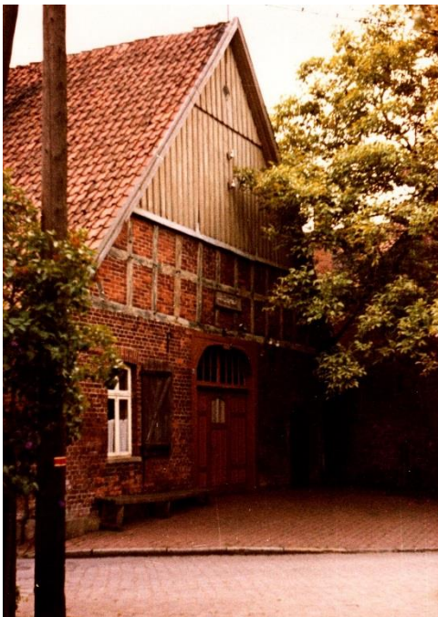
Geschäftshaus Windheim 105, jetzt Weserstraße 32