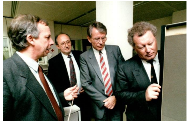
1990, Führungen aus Anlass der Einweihung des Siemens/Fujitsu-Rechners VP200-EX