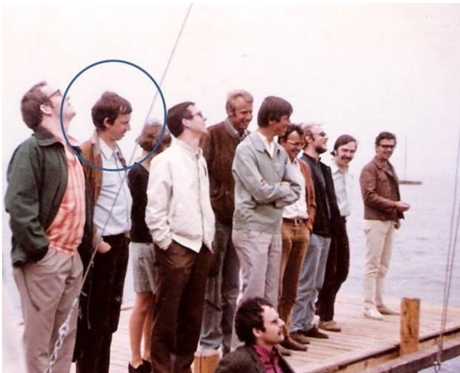
1971, Betriebsausflug zum Steinhuder Meer