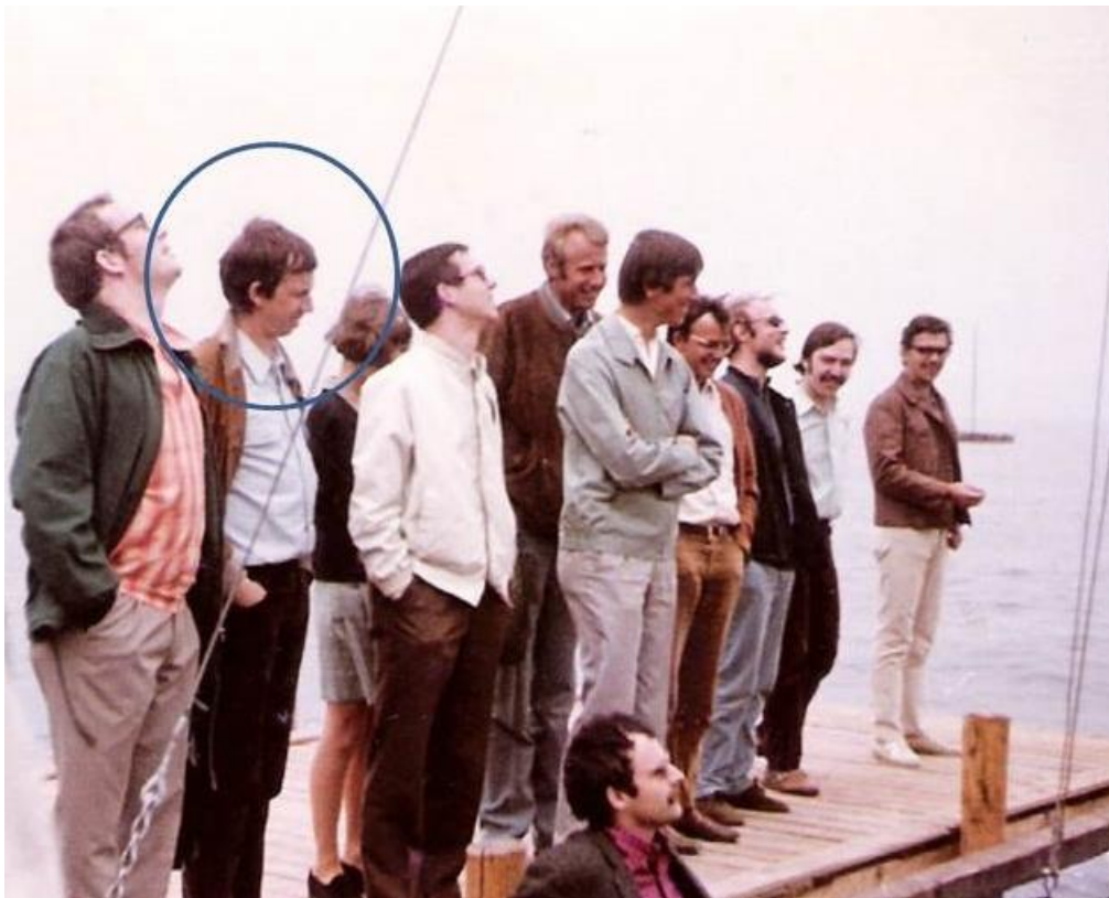
1971, Betriebsausflug zum Steinhuder Meer