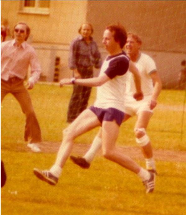
1975, Fußball-Spiel RRZN gegen CDC