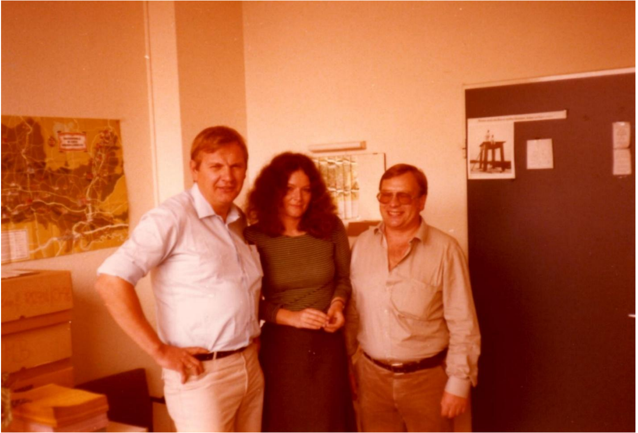
Datum unbekannt, vor 1986 in der Wunstorfer Str. 14