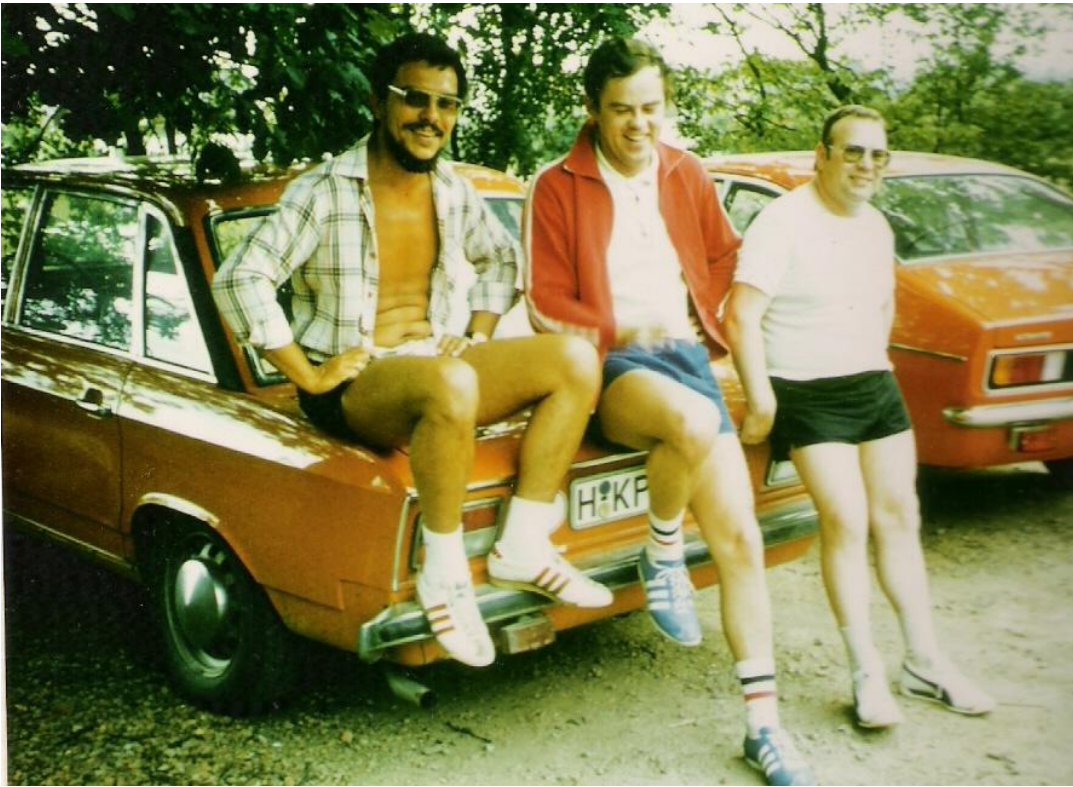
rechts, Laufgruppe am Benter Berg ( Es fehlen die Läufer: W. Heerhorst, W. Stehr )