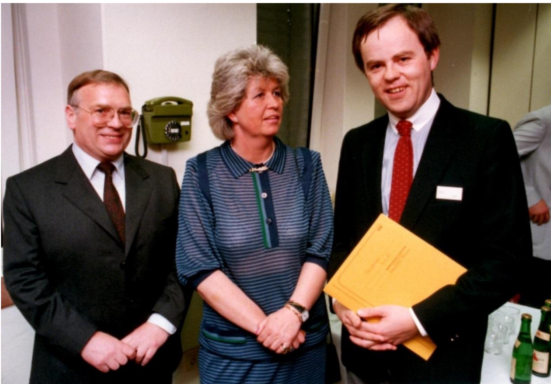
links, 1986, Einweihung des neuen RRZN-Standortes Schloßwender Str. 5