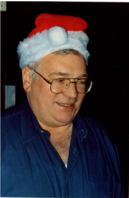
bei einer Weihnachtsfeier