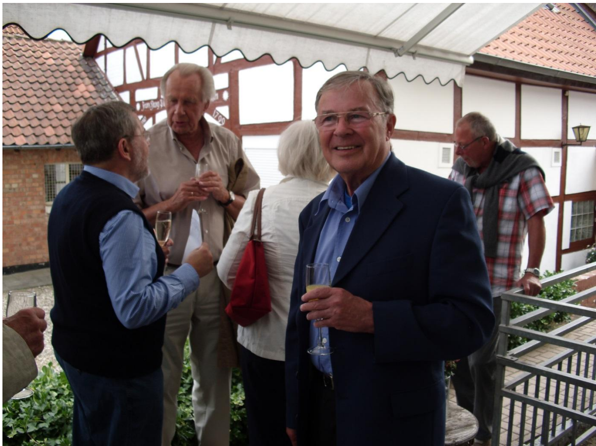
10. Juni 2011, Abschiedsfeier WN im Hotel Haase, Grasdorf