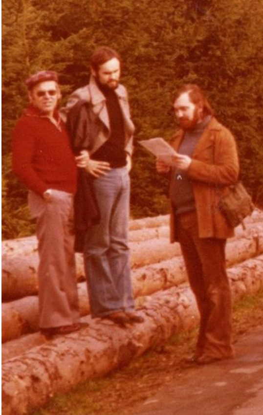
1970, Wandertag im Solling