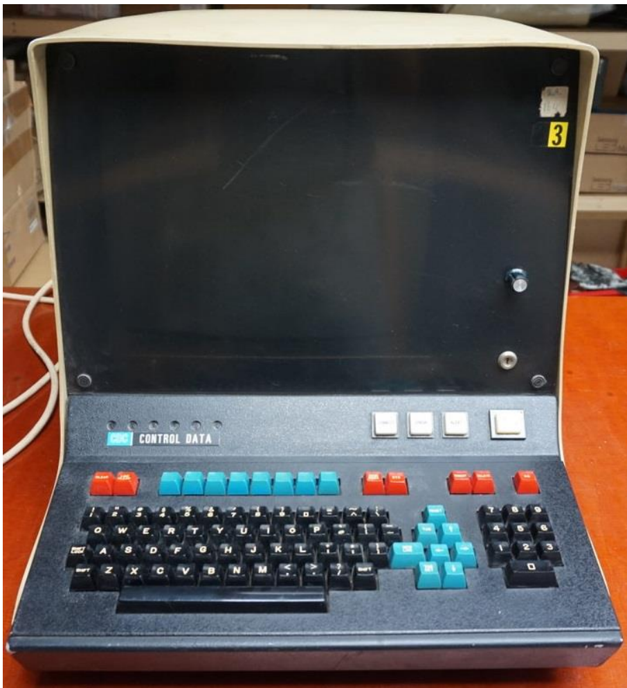
CDC 713 asynchrone Übertragung, max. Übertragungsrate 300 bps