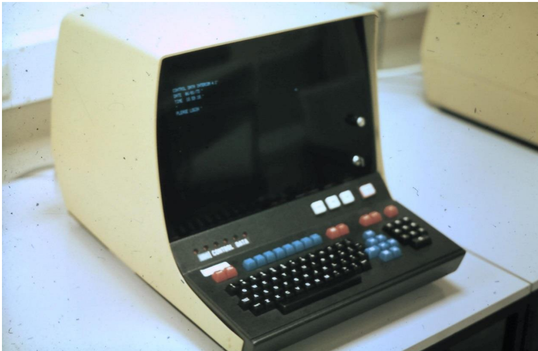
Terminal CDC 711, synchrone Übertragung über CDC-Protokoll UT 200M, max. Übertragungsrate 4800 bps